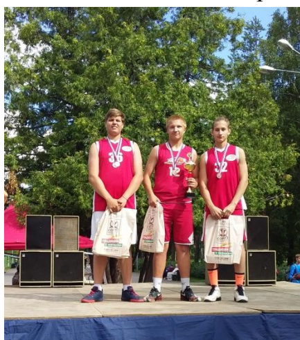
Парни! Мы гордимся Вами!