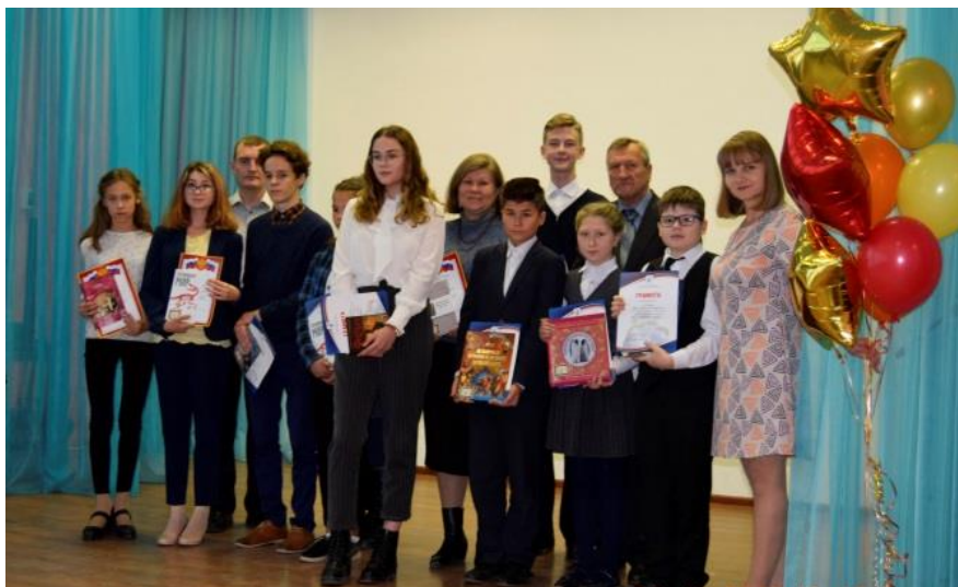
Мы лучшие читатели!

Неделя детской и юношеской книги в Централизованных библиотечных системах Челябинской области - это калейдоскоп увлекательных мероприятий. Проведено более 300 массовых мероприятий, на которых побывали десятки тысяч читателей. Мероприятия отличались разнообразием форм, тем. Организовывались встречи, день молодых художников, мастер – классы по изготовлению самых разных поделок.