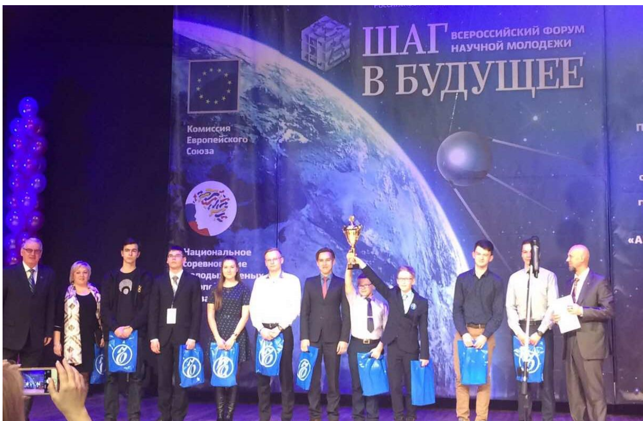
Молодые исследователи Челябинской области на награждении. Поздравляем!