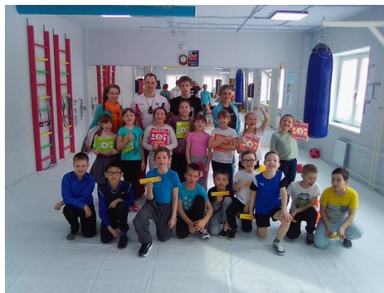
Дети счастливы и это главное!

Целью и задачами этого проекта является физическое и духовное оздоровление молодежи, системная профессиональная работа с детьми и подростками, проведение тренировок, показательных выступлений воспитанников в школах города, организация спортивных состязаний и выступлений, проведение открытых лекций и дискуссий об отношении к своей жизни, здоровью.