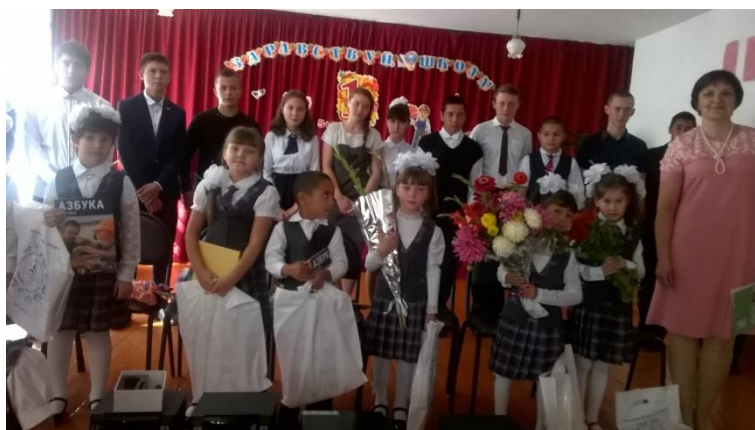
Праздник «Здравствуй школа» в Уйском районе