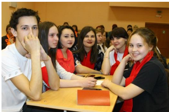
К игре готовы!

28 марта состоялась городская краеведческая игра для юношества