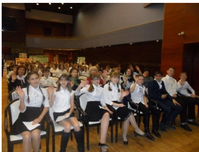
Участники Конференции. Зал полон.

Следует отметить совместную деятельность ЧОО РДФ с некоторыми общественными организациями области по развитию основных идей программы «Юному таланту».