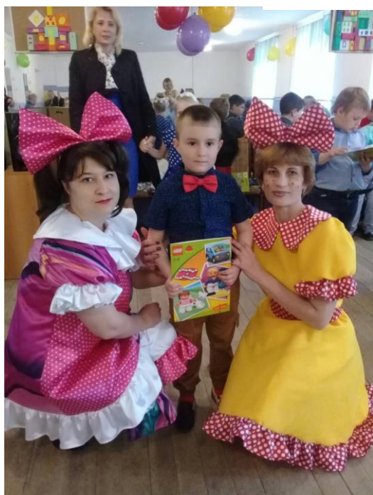
Дом детского творчества Октябрьского района. Праздник для детей