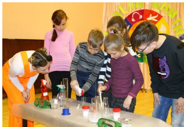
Тихо! Идет эксперимент! Праздник закрытия

30 марта были Невероятные приключения в НИИЧАВО (Научно-исследовательский институт Чрезвычайно Актуальных Опытов) , который занимается вопросами научно-технического прогресса в сказках. В этом институте сотрудниками могут работать только дети и герои книг.