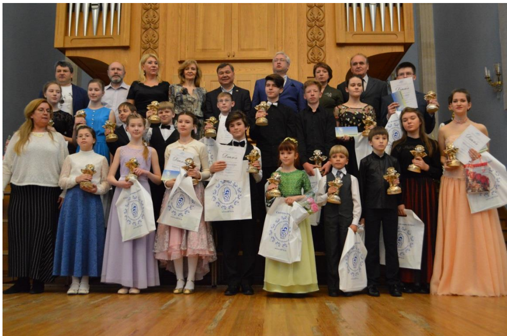
Победители программы «Новые имена»

Продолжается работа Челябинского областного отделения Фонда по программе «Новые имена – новое поколение» . Эта программа нацелена на выявление талантливых детей в области, на оказание различных форм