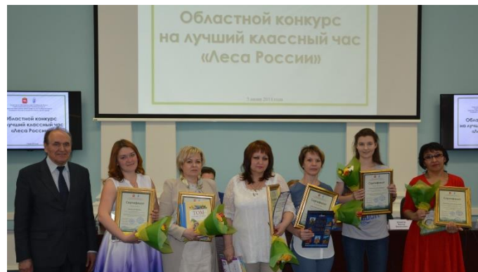
Другие победительницы, занявшие 2 и 3 места. ПОЗДРАВЛЯЕМ!

Организаторами этого тематического конкурса стали Челябинское областное отделение Российского детского фонда, Главное управление лесами Челябинской области, общественный совет при ГУ лесами, Министерство образования и науки области, Управление общественных связей Правительства области, Общественная палата Челябинской области,