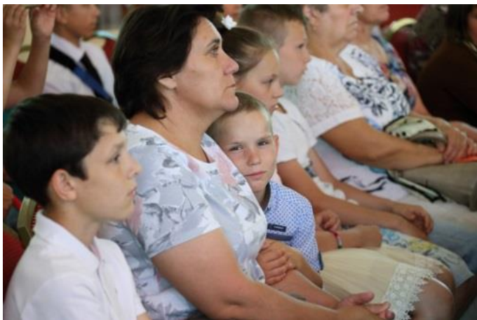
Внимательные зрители областного фестиваля семей, воспитывающих детей-сирот

Челябинское областное отделение Российского детского фонда приняло активное участие в подготовке и проведении VIII областного фестиваля семей, воспитывающих детей-сирот и детей, оставшихся без попечения родителей, который традиционно проходит в области в канун дня семьи, любви и верности.