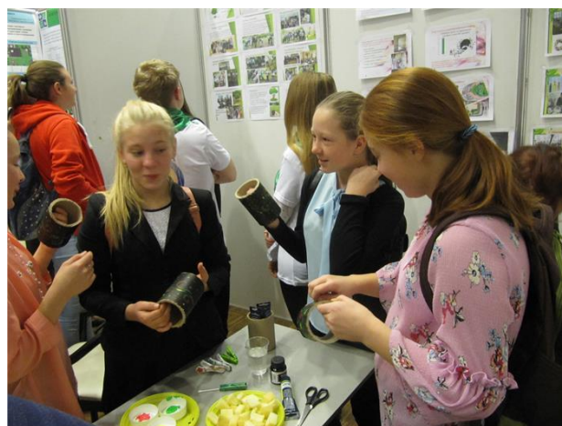
Изучение одного из проектов Форума-выставки

Так, в рамках ежегодного IX Международного Форума-Выставки «Изменение климата и экология промышленного города» проходил VIII областной Форум «Молодежь за экологию и культуру» . На Форум было заявлено