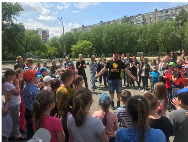
В здоровом теле - здоровый дух!