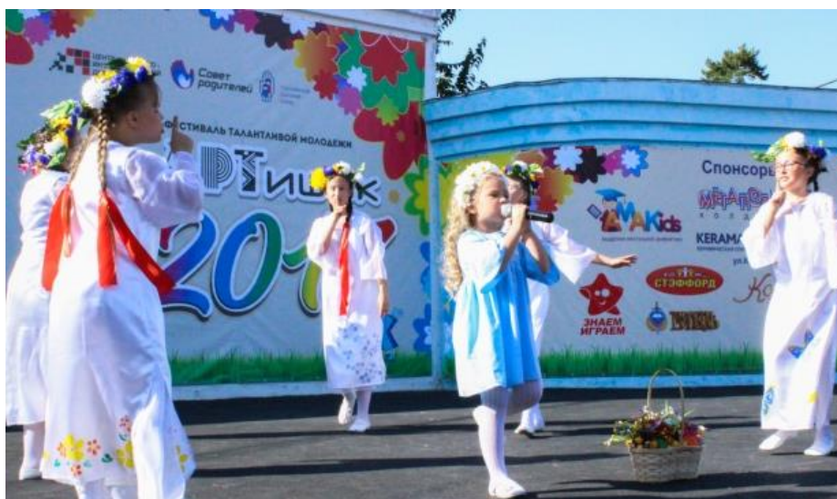
Юные звездочки фестиваля «Артишок»

«Артишок» - это незабываемый семейный праздник, он дает возможность юным звездочкам проявить себя, показать свой талант на большой сцене. Гала-концерт в 2018 году объединил более 300 участников и 26 творческих коллективов.