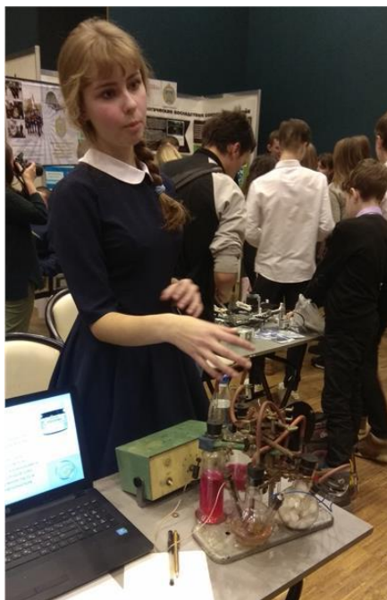
Представление одного из проектов Форума-выставки