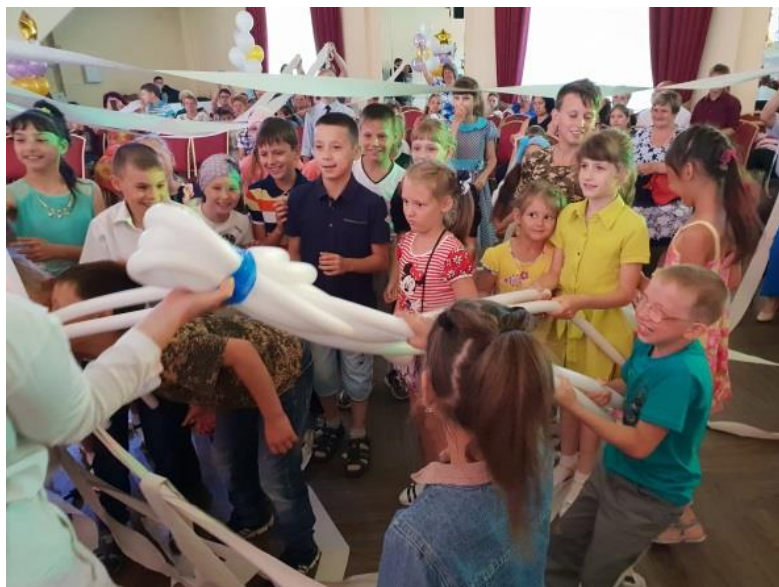
Праздник в разгаре. Дети счастливы!

С 2014 года по настоящее время удалось добиться значительного сокращения численности детей-сирот и детей, оставшихся без попечения родителей, нуждающихся в семейном устройстве, на 54,7%. В настоящее время в банке данных детей-сирот находится 1991 ребенок, в 2014 году в нем состояло 4 тысячи 399 детей.